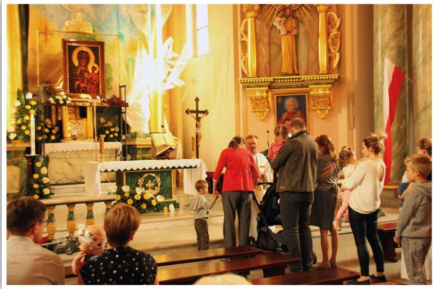
Nabożeństwo dla matek w stanie błogosławnym i z małymi dziećmi