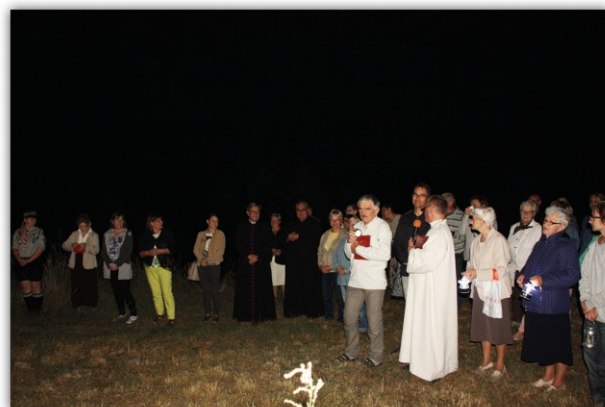
Apel Jasnogórski przy Krzyżu na Wyszogrodzie