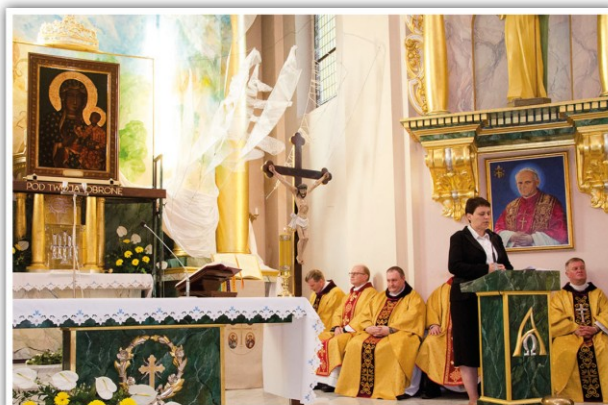
Mszę św., pod przewodnictwem ordynariusza diecezji bydgoskiej, bp. Jana Tyrawy, sprawowali księża dekanatu fordońskiego