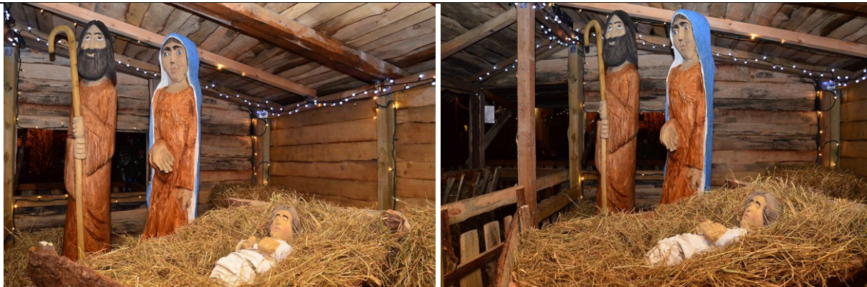
Szopka na Rynku w Starym Fordonie